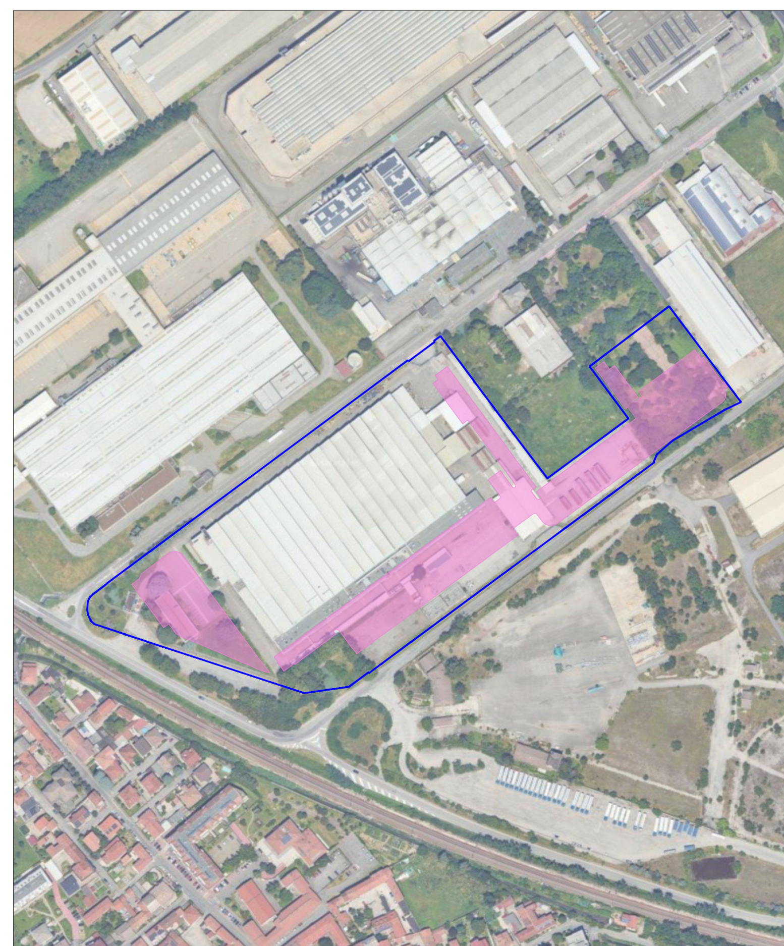
Superficie territoriale da Rilievo 64.414,1 mq Parcheggi pertinenziali 19.621,0 mq