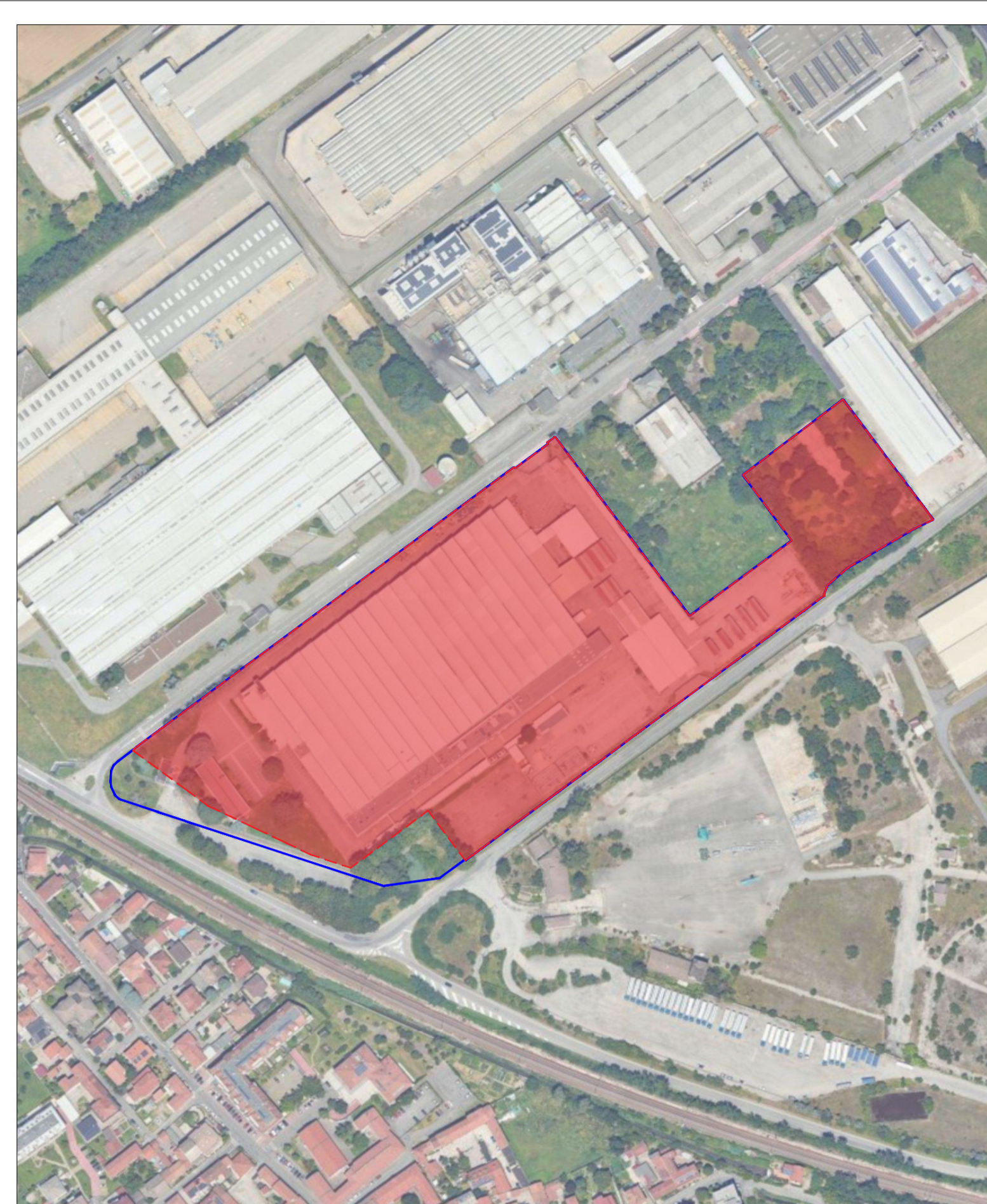
Superficie territoriale da Rilievo 64.414,1 mq Superficie fondiaria 60.425,1 mq