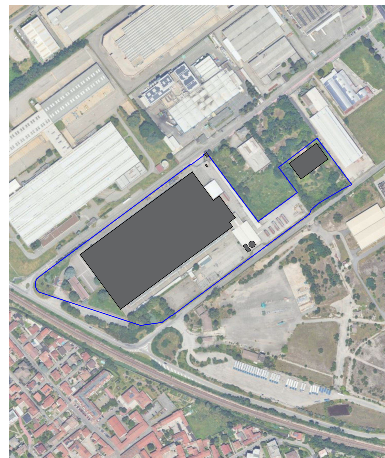
Superficie territoriale da Rilievo 64.414,1 mq Superficie coperta 27.525,8 mq