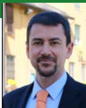
ANGELO BOSANI SINDACO

GOVERNO DEL TERRITORIO MARKETING TERRITORIALE E MIND PROTEZIONE DEL TERRITORIO E DELLA COMUNITÀ COMUNICAZIONE E PARTECIPAZIONE