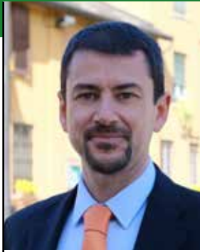
ANGELO BOSANI SINDACO

GOVERNO DEL TERRITORIO MARKETING TERRITORIALE E MIND PROTEZIONE DEL TERRITORIO E DELLA COMUNITA' COMUNICAZIONE E PARTECIPAZIONE