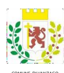
COMUNE DI VANZAGO