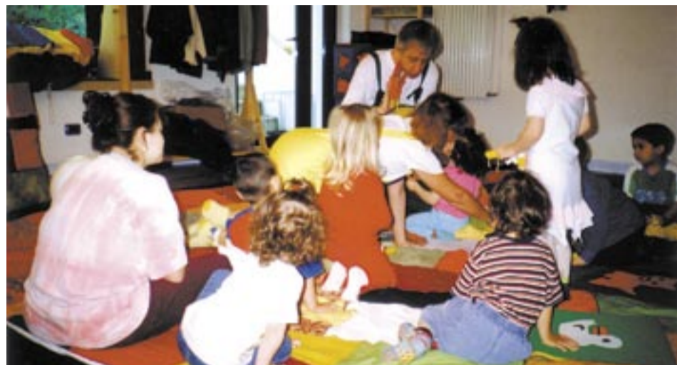
Un momento del laboratorio di lettura

L'asilo nido presente nel comune di Pregnana da quasi 2 anni, è stato protagonista in questo tempo di varie iniziative rivolte ai bambini e alle loro famiglie: dalle feste insieme alle giornate di apertura alla cittadinanza, dalle serate a tema allo spazio incontro per le famiglie.