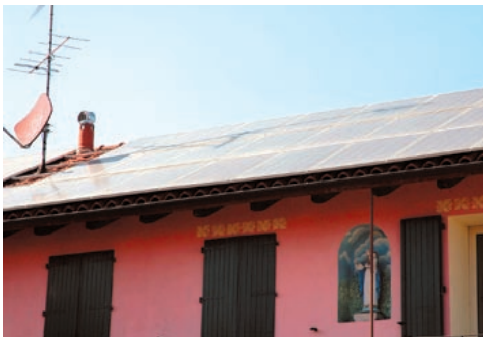
Il particolare del tetto con pannelli fotovoltaici dell'azienda

virtuoso energetico ad alta efficienza; ulteriormente l'energia elettrica in eccesso prodotta dall'impianto fotovoltaico viene immessa in rete ENEL, la quale acquista i KW prodotti per 20 anni a prezzi superiori al valore di mercato: il tutto regolato dal Conto Energia (Direttiva 2001/77/CE), cioè dagli incentivi comunitari per la produzione di energia da fonti rinnovabili. La struttura agrituristiche nel prossimo futuro (Pasqua 2008) ha in previsione l'apertura di un Ristorante oltre al macello per la vendita dei prodotti aziendali. Inoltre, titolata dalla regione Lombardia come Fattoria Didattica, organizzerà per i bimbi, nei periodi opportuni di riproduzione, visite guidate alla pulcinaia, mentre gli anziani potranno visitare l'azienda per conoscere il processo di crescita, macellazione e lavorazioni della nostra fauna agricola per la produzione di elaborati gastronomici che saranno posti in vendita.