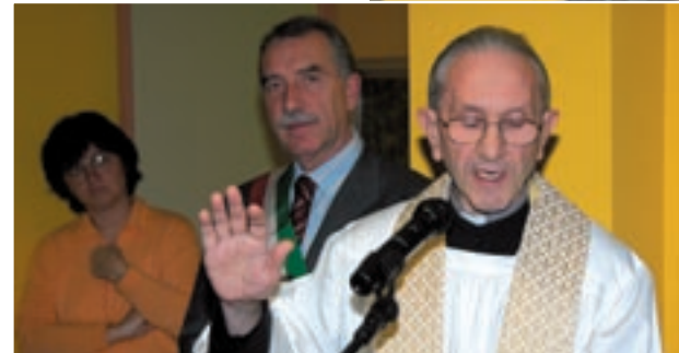
Inaugurazione della Scuola Materna "Bruno Munari"

Oggi a distanza di venticinque anni la Parrocchia ha subito molte trasformazioni; ora si presenta come una realtà molto eterogenea sia religiosamente che socialmente. Le nuove generazioni, la mobilità della popolazione, la secolarizzazione l'hanno posta di fronte a grandi sfide che si possono vincere solo con il passaggio ad una religiosità più convinta e ad una scelta di fede più comunitaria.