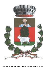
COMUNE DI CORNAREDO