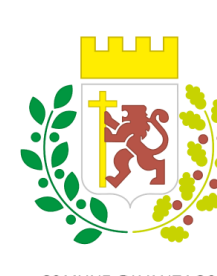
COMUNE DI VANZAGO