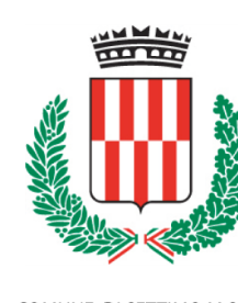
COMUNE DI SETTIMO M.SE